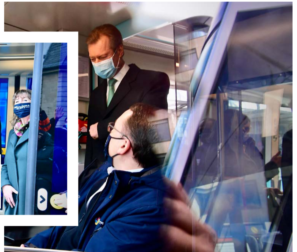
Schaffner für einen Tag: Als Ehrengast darf Großherzog Henri bei der Jungfernfahrt natürlich auch im Führerstand vorbeischaun